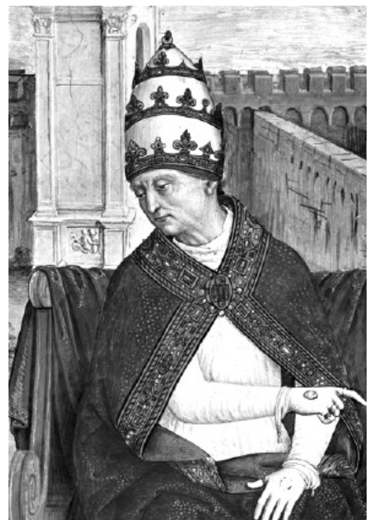
Münster für Kinder