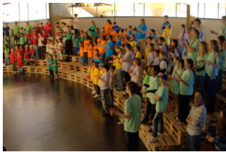
Wanderung Rammlinsburg Senioren